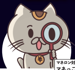
マネロン対策キャラクター マネっこちゃん

金融機関をご利用のお客さま一人一人の情報を確認することで 犯罪収益の移転やテロ資金供与を、防止することができます